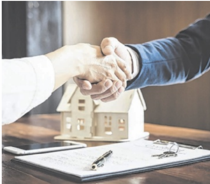
Auf den Immobilienkauf sollte man sich gut vorbereiten.

Nußbaumer: Wir erleben einen rapiden Marktwandel. Meist dreht sich alles um die Themen Eigenmittel, Zinsen und Energiekrise. Dabei sind nicht alle Bereiche des Immobilienmarktes betroffen. Zwar stagnierte die