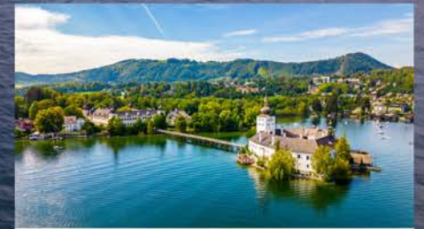
Gmundner Schloss Ort