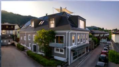
Das einmalige Penthouse